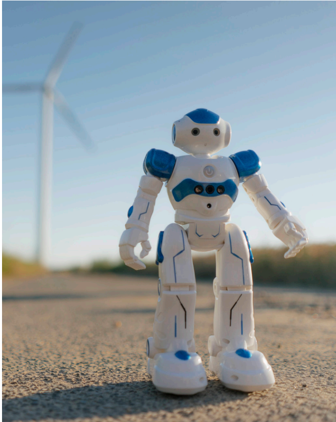
Neue Energie, KI und Nachhaltigkeit: Themen für die substanzielle Geldanlage.

▼ Aktienmärkten austarieren. Darauf aufbauend braucht es die nötige Geschwindigkeit bei der Anpassung an die Vielfalt der Themen wie KI, Nachhaltigkeit oder Energieversorgung. Denn da ändern sich die Rahmenbedingungen ja deutlich schneller als in früheren Zeiten – denken Sie nur einmal an die ganzen Förderprogramme und Regularien, aber auch den technischen Fortschritt in solchen Feldern. Die Möglichkeiten am Markt entwickeln sich dynamisch – und die wollen wir mit aktivem Management nutzen.