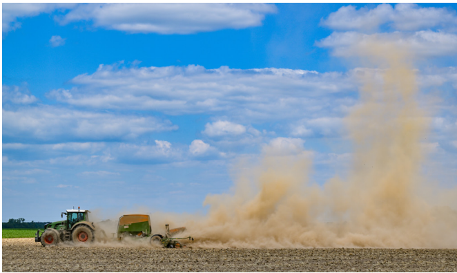
Inflationstreiber Klimawandel: Ein Landwirt drillt Saatgut in den ausgetrockneten Acker. Die obersten Schichten sind so trocken wie sonst im August.